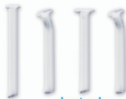
Lester Jones Tubes